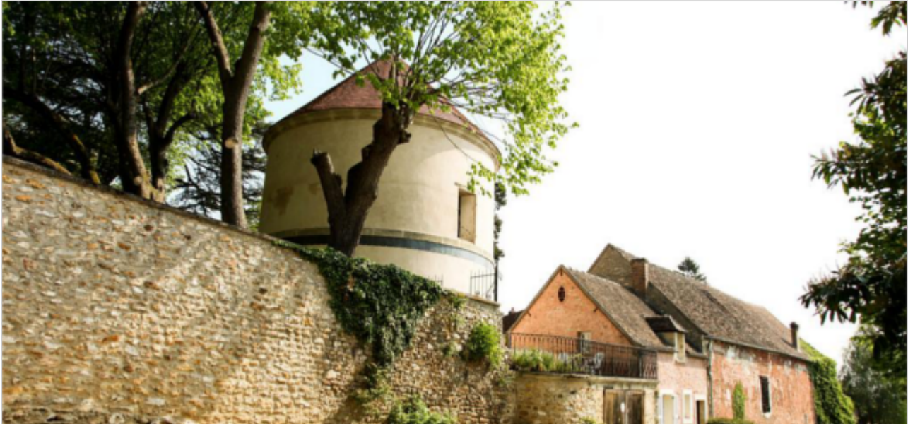
Gite de la ferme Rose